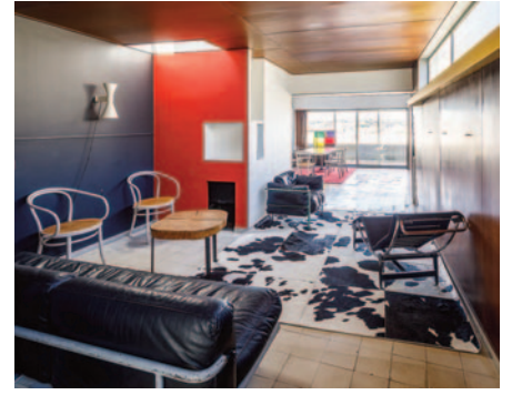
Appartement-atelier, Le Corbusier, Paris 16 ème .

Les propositions de communication (20 mn maximum, les études de cas de moins de 10 mn étant tout à fait possibles) sont à envoyer à Agnès Barruol, CAOAF des Bouches-du- Rhône sous la forme d'un résumé de 5 à 10 lignes présentant le contenu de l'intervention, avec un titre.