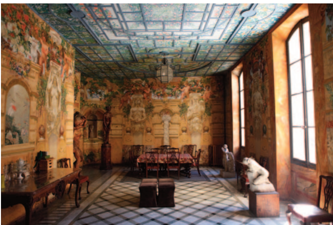
Hôtel de Luppé, Arles, salle à manger.

Agnès Barruol, conservateur des antiquités et objets d'art des Bouches-du-Rhône, conseil départemental, 52 Avenue de Saint-Just, 13004 Marseille, tél : 06 12 68 59 87 Adresse mail : agnes.barruol@departement13.fr