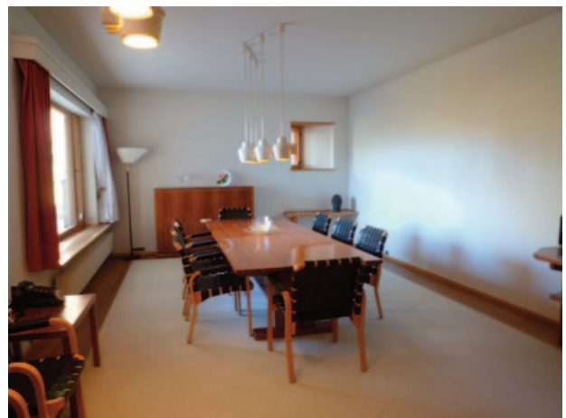
Maison atelier d'Alvar Aalto, Bazoche.