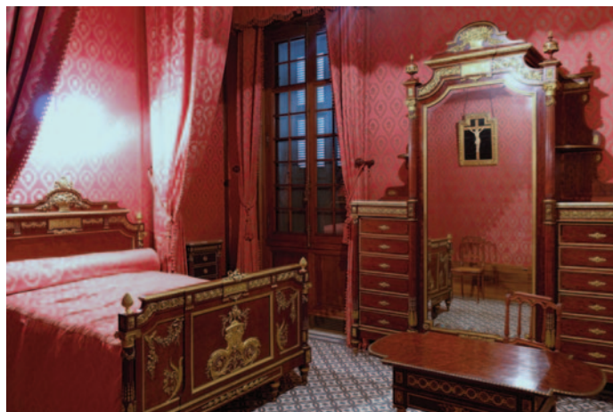
Domaine départemental du château d'Avignon, Les Saintes-Maries-de-Mer, l'escalier d'honneur, la chambre néo-classique, le grand salon.